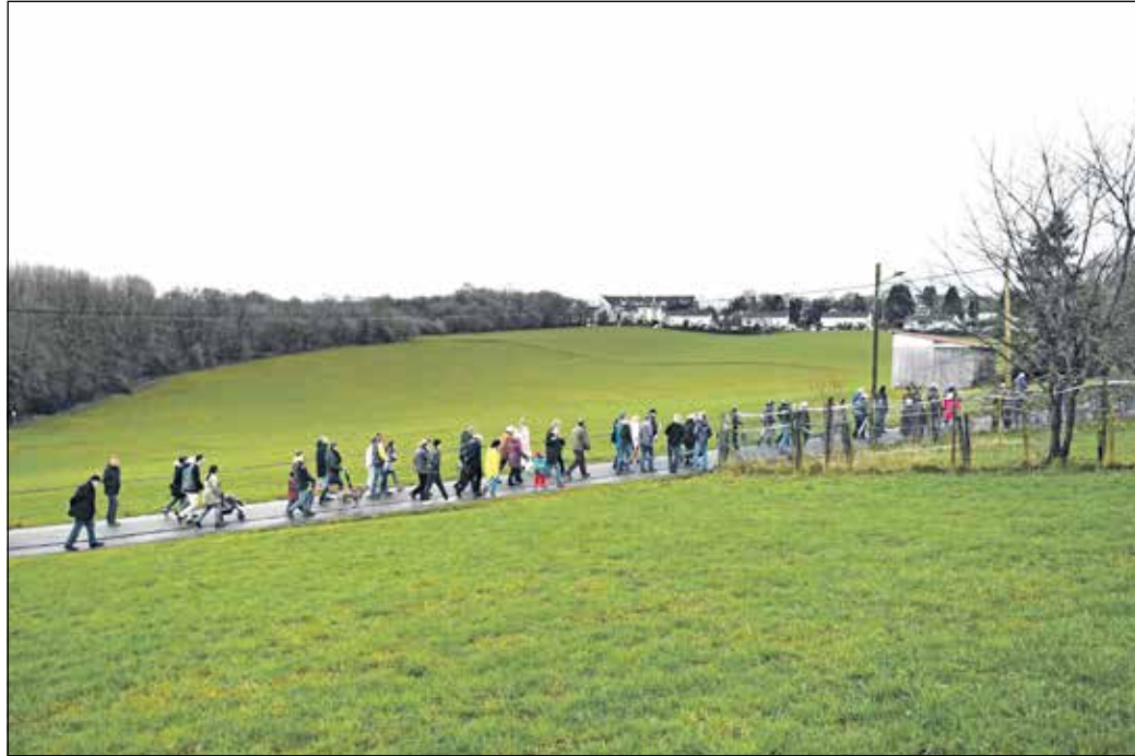
Im März 2020 protestierte die Initiative „Marpe für Alle“ gegen die Bebauung der Fläche.