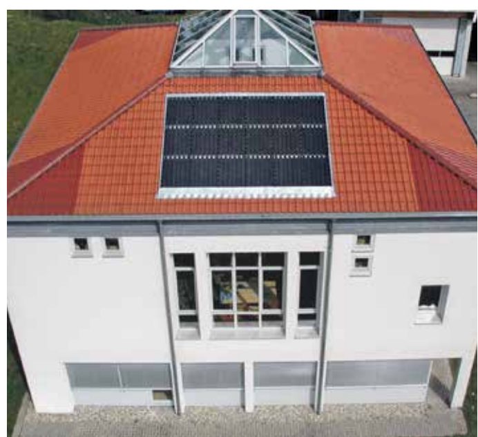
Für das Planen, Vermessen und Begutachten von Dächern setzen Dachdecker vermehrt auch auf den Drohneneinsatz.