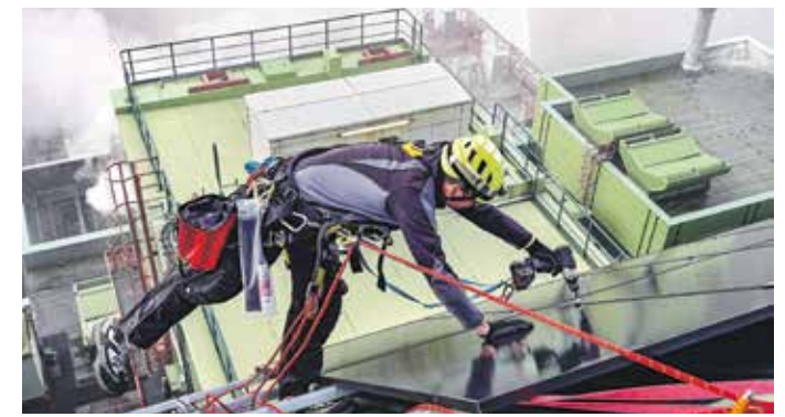
Industriekletterer montierten auf dem Dach des Kesselhauses der Thermischen Abfallbehandlungsanlage (TAB) die PV-Module.

Die auf der Schräge des südlichen Kesselhausdachs platzierte PV-Anlage kann pro Jahr bis zu 42.000 kWh liefern. Mit dem produzierten Strom könnte man beispielsweise bis zu 800 Mal ein Elektroauto mit einem Akku von 50 kWh laden. „Klein, aber fein – und das richtige Signal, um den