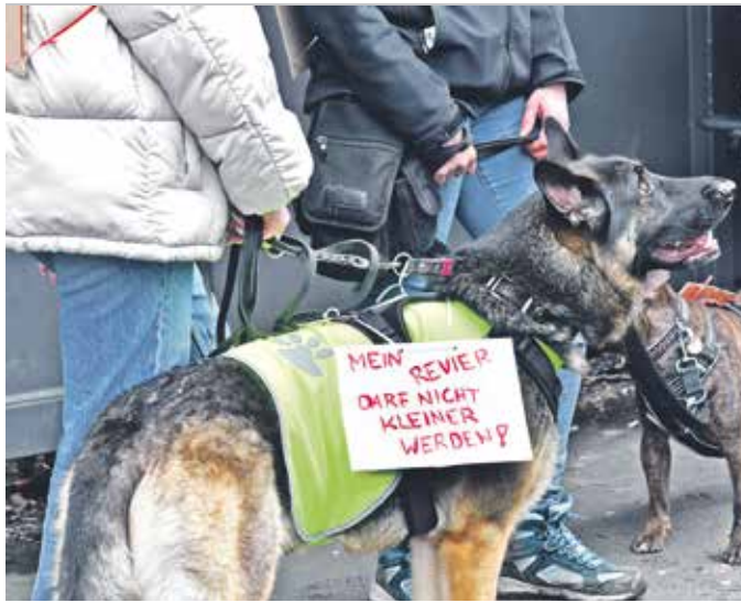
Schäferhündin Lotti war eine der zahlreichen vierbeinigen Demonstranten. Viele Hundebesitzer fürchten um die Attraktivität der Ronsdorfer Anlagen.