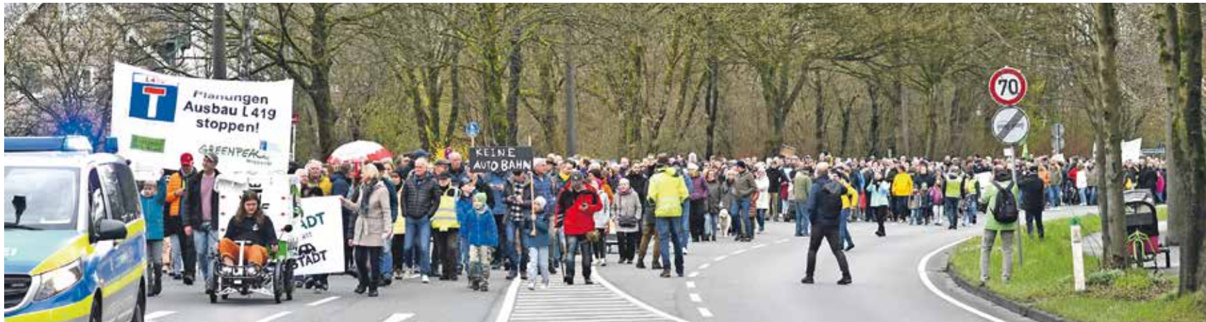
Bis auf die Sprechchöre und die Musik der Demonstranten war es auf der L419 ohne den Verkehrslärm so still wie sonst nie.