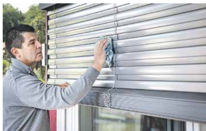
Mit wenig Aufwand lassen die die Sonnenschutzsysteme von Schmutz und Flecken befreien.

Für eine optimale Wirkung und eine besonders komfortable Bedienung können die Fachbetriebe den Sonnenschutz auch mit Antriebsmotoren, Sensoren und einer automatischen Steuerung ausstatten, auch bestehende Anlagen. Weitere Infos unter www.rolllaeden-sonnenschutz.de .