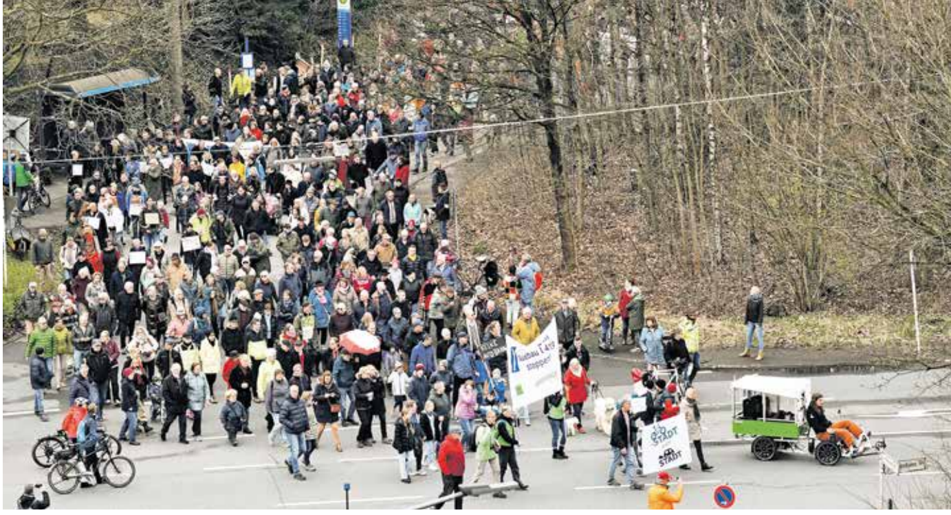
Von der Bushaltestelle Parkstraße (Am Knöchel) zogen die Demonstranten los. Auf zahlreichen Schildern und Transparenten taten sie ihre Meinung kund.