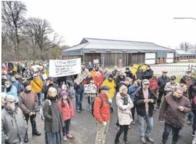
Im Hintergrund: Ein Teil der Baufläche für die Forensik an der Parkstraße.

Neben dem Verlust von Grünflächen und dem aus ihrer Sicht mangelhaftem Lärmschutz (entlang der Ronsdorfer Anlagen ist z.B. kein Lärmschutz vorgesehen) ist der Verkehr in Ronsdorf ein Argument der Ausbaueegner: Sie befürchten, dass der zusätzliche Verkehr, den das Land NRW für die L419 nach dem Ausbau prognostiziert, sich nicht auf die neue Straße beschränken wird. Auch für die Ronsdorfer Innenstadt gehen sie von längeren Wartezeiten und mehr Staus aus.