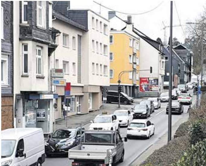
In der Elias-Eller-Straße staute es sich während der Demo. Ein Vorgeschmack auf die Bauphase und die Zeit nach dem Ausbau der L419?