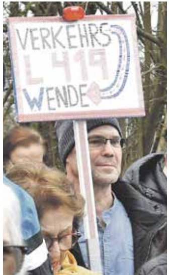
L419-Ausbau und Verkehrswende – ein Widerspruch?