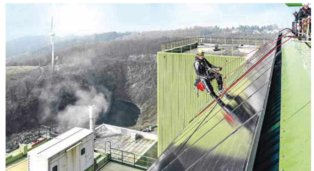
Auf der Schräge des südlichen Kesselhausdachs wurde die PV-Anlage installiert.

Auch beim Thema „Solarenergie“ arbeiten WSW und AWG zusammen: Gemeinsam werden derzeit geeignete AWG-Flächen gesucht, auf denen weitere PV-Anlagen errichtet werden könnten.