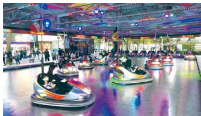
Der Autoscooter gehört traditionell zur Kirmes und bietet viel Spaß.

Aus der Himmelfahrtskirmes wird die „Barmer Sommerkirmes“, die vom 7. bis 10. Juni in der Fußgängerzone am Werth gefeiert wird.